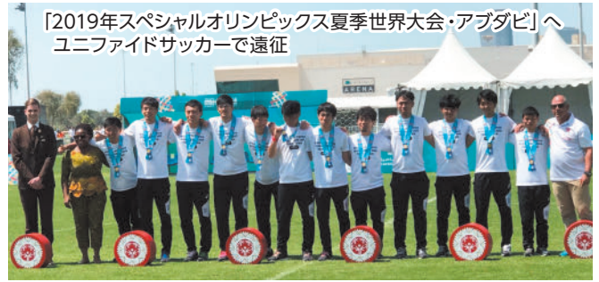
「2019年スペシャルオリンピックス夏季世界大会・アブダビ」へユニファイドサッカーで遠征